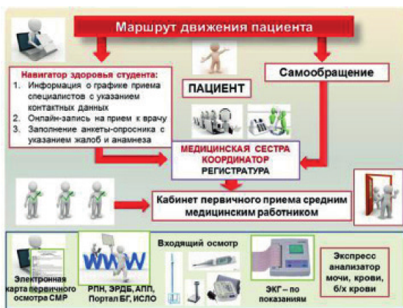
Рис. 3. Маршрут движения пациента в Центре ПМСП