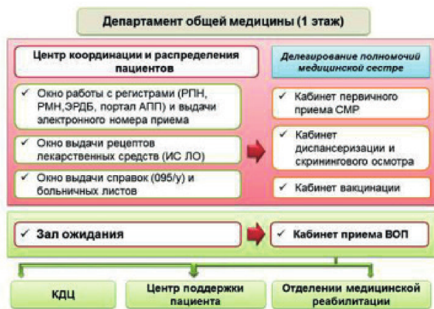
Рис. 2. Структура Департамента общей медицины Центра ПМСП