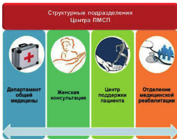
Рис 1. Структурные подразделения Центра ПМСП