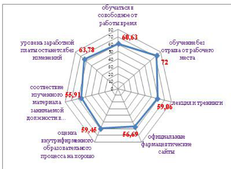
Рис. 2. Результаты анализа внутрифирменного обучения по различным характеристикам.

следует вывод, что знания были полезны и актуальны, уровень заработной платы останется без изменений.