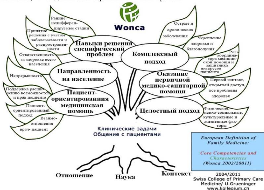
Рис. 1. Дерево WONCA (см. объяснения в тексте).

условий для функционирования и развития семейной медицины (Контекст). Это подразумевает, в первую очередь, первоочередное финансирование и материально-техническое снабжение первичного уровня здравоохранения, адекватную заработную плату и социальные гарантии медработникам ПМСП, в первую очередь семейным врачам.