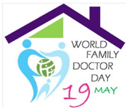
Рис. 2. Эмблема (логотип) Всемирного дня семейного врача, предложенная WONCA в 2015 году.