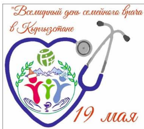
Рис. 4. Эмблема ВДСВ-2017 в Кыргызстане.