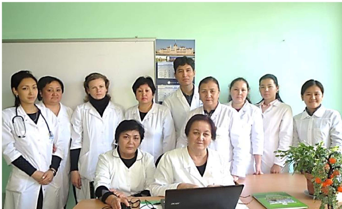
Сотрудники кафедры в 2016 г.

активное участие в работе по ликвидации пандемии COVID-19 в стране февраля 2020г. по настоящее время.