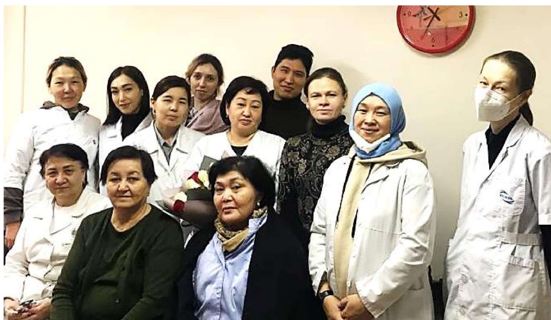
Сотрудники кафедры в 2022 г.