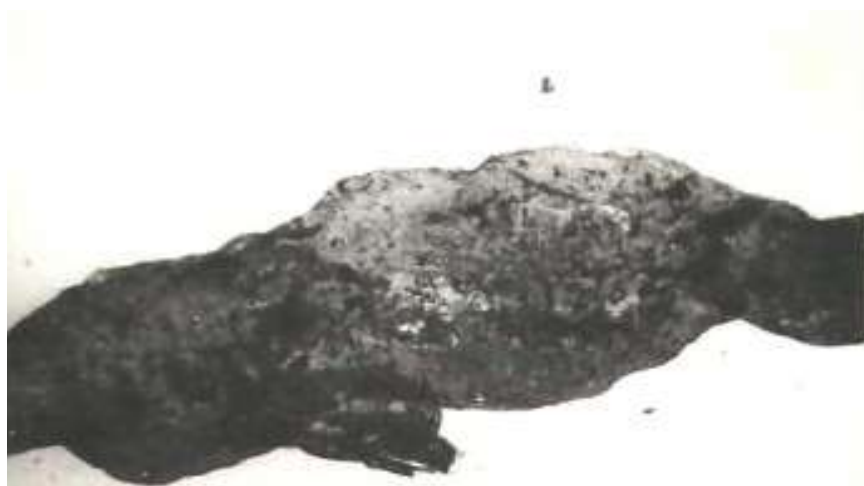
Рис. 2 «Грибовидные» выпячивания лимфангиона экстраорганного лимфатического сосуда. Мужчина 85 лет. Масса Герота.